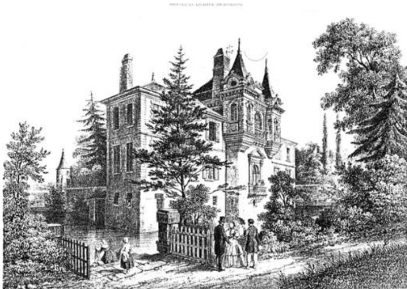
Lithographie de Félix Benoist, 1850